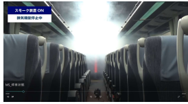
【試験前 スモーク充填時の様子 (MS、HD) 車】