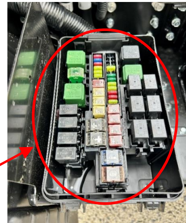
《 ハイカレントヒューズボックス内のリレー等 》

電動トラックのハイカレントヒューズボックスに接続しているハーネスにおいて、分岐部に施している保護テープによる防水処置が不適切なため、保護テープが損傷するとハーネス内部に水が浸入してハイカレントヒューズボックス内で結露水が発生することがある。