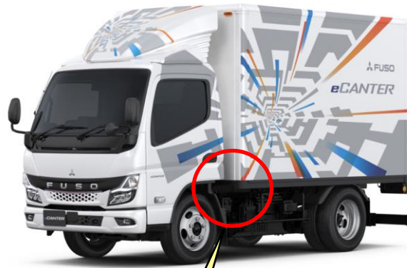
ハイカレントヒューズボックスの蓋裏側に付着した結露水