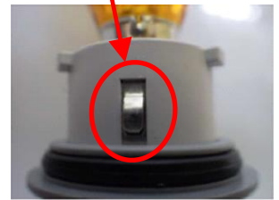
バルブソケット取り外し状態