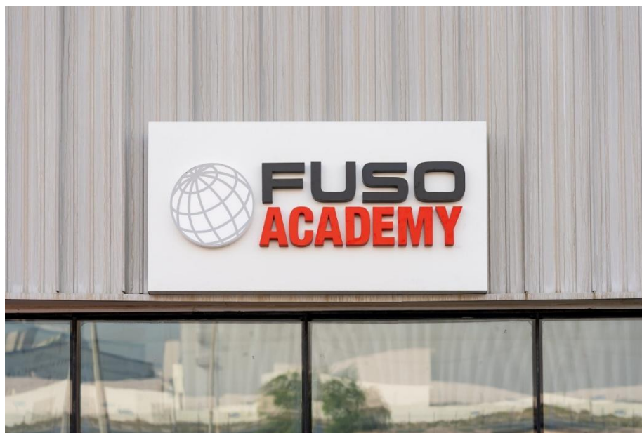
FUSO Academy Dubai 外観

FUSO Academy Dubai (以下、同センター)は、中東・アフリカ地域における MFTBC の地域統括会社である FUSO Commercial Vehicles Middle East & Africa FZE によって運営されます。技術および営業・サービス研修を提供する地域ハブとして、市場により近い場所で体系的かつ一貫した人材育成を行います。また、MFTBC の専門教育機関である「FUSO アカデミー」が定めるグローバルに統一した研修基準に基づき、中東・アフリカ地域特有のニーズに応じたプログラムを提供します。